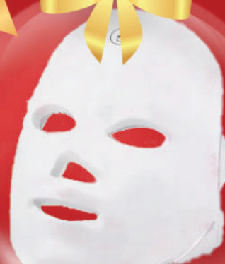
Máscara Led 7 Colores

“Regalo por compras superiores a 100€ de base imponible” “Promoción valida hasta fin de existencias”